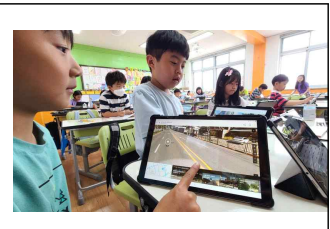
3학년 체인지메이커 우리 마을 교통 위험 조사