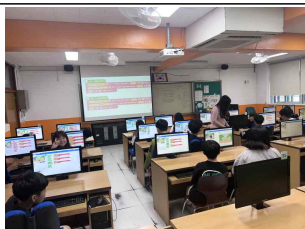
(6학년) SW 코딩 교육