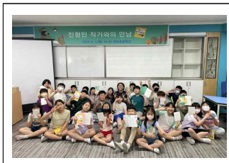
(4학년) <소리질러 운동장> 작가와의 만남