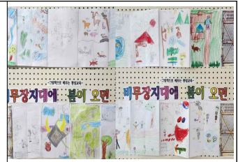
(2학년)그림책으로 만나는 통일교육