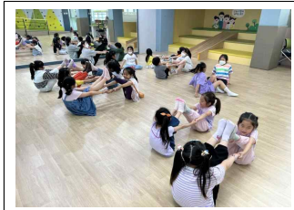
(2학년) 댄스 동아리 활동