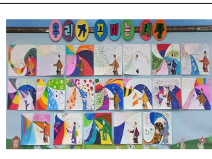
(5학년) 폴시냐크 따라잡기