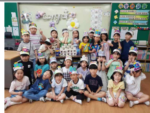
(1학년) 백일 축하 파티