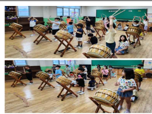
(2학년) 난타 동아리 활동