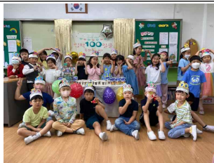
(1학년) 백일을 축하해요!