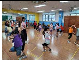
(2학년) 전래놀이 동아리 활동