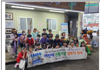
(3학년) 체인지메이커 삼미시장 투어