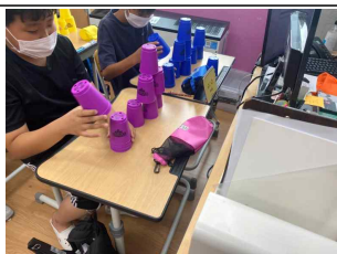
(5학년) 스피드 스택스