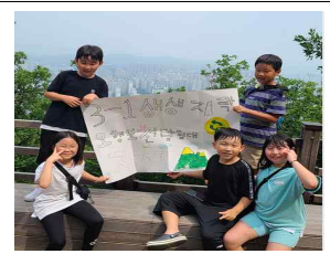
(3학년) 체인지메이커 소래산환경보호캠페인