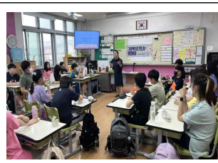
(6학년) 그림책으로 만나는 평화교육