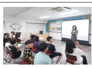
(5학년) 작가와와의 만남