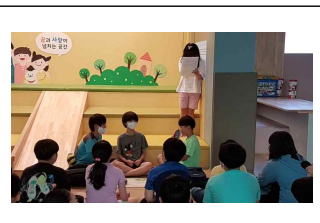
(4학년) 교육 연극 활동