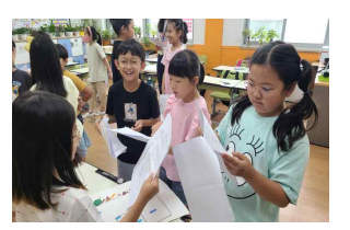
즐거움 연극 대본 연습