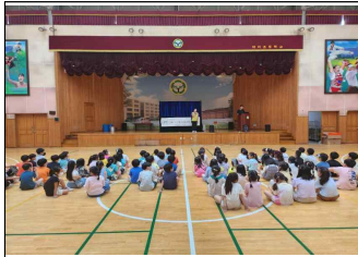
(1학년) 성폭력예방교육 인형극 관람