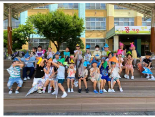
여름 소품을 가지고 야외학습장에서 한 컷!