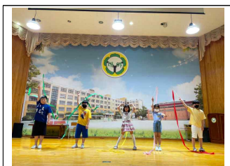
(4학년) 리듬체조 발표회