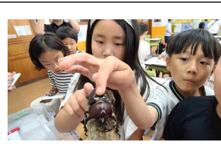
(3학년) 과학 동물의 세계