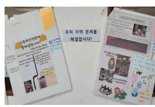
체인지메이커 지역문제를 해결하자