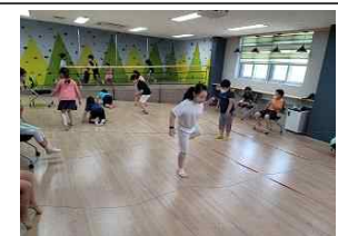
(2학년) 여름 동산 친구들과 놀아요