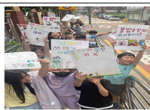
(4학년) 지역문제 알리기 캠페인 활동