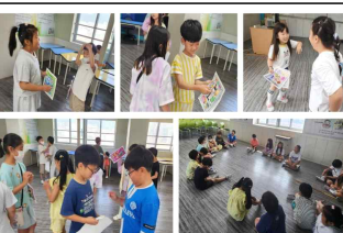
(2학년) 친구 사랑 자판기 활동