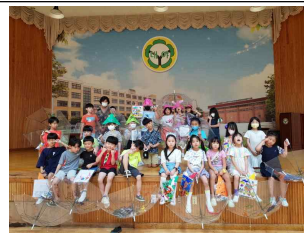
(1학년) 여름 패션쇼를 마치고~