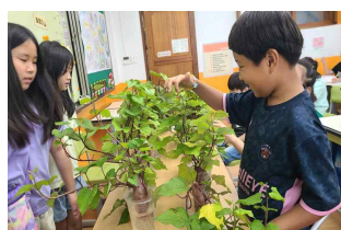
생태감수성교육 (반려식물 숲 가꾸기)