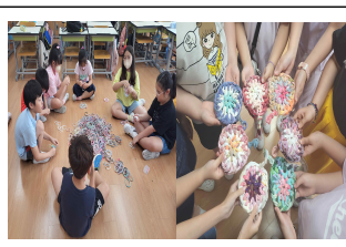
(3학년)엿사이클링 양말목 냄비받침 만들기